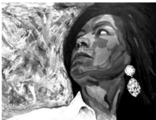
Fotografía: Rosy Revelo (2018).

Correo electrónico: rosyrevelo@gmail.com